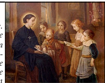
Suore di Carità dette di Maria Bambina